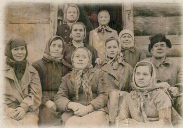
Колхозная бригада после трудового дня