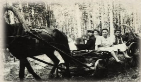
Транспорт середины XX века